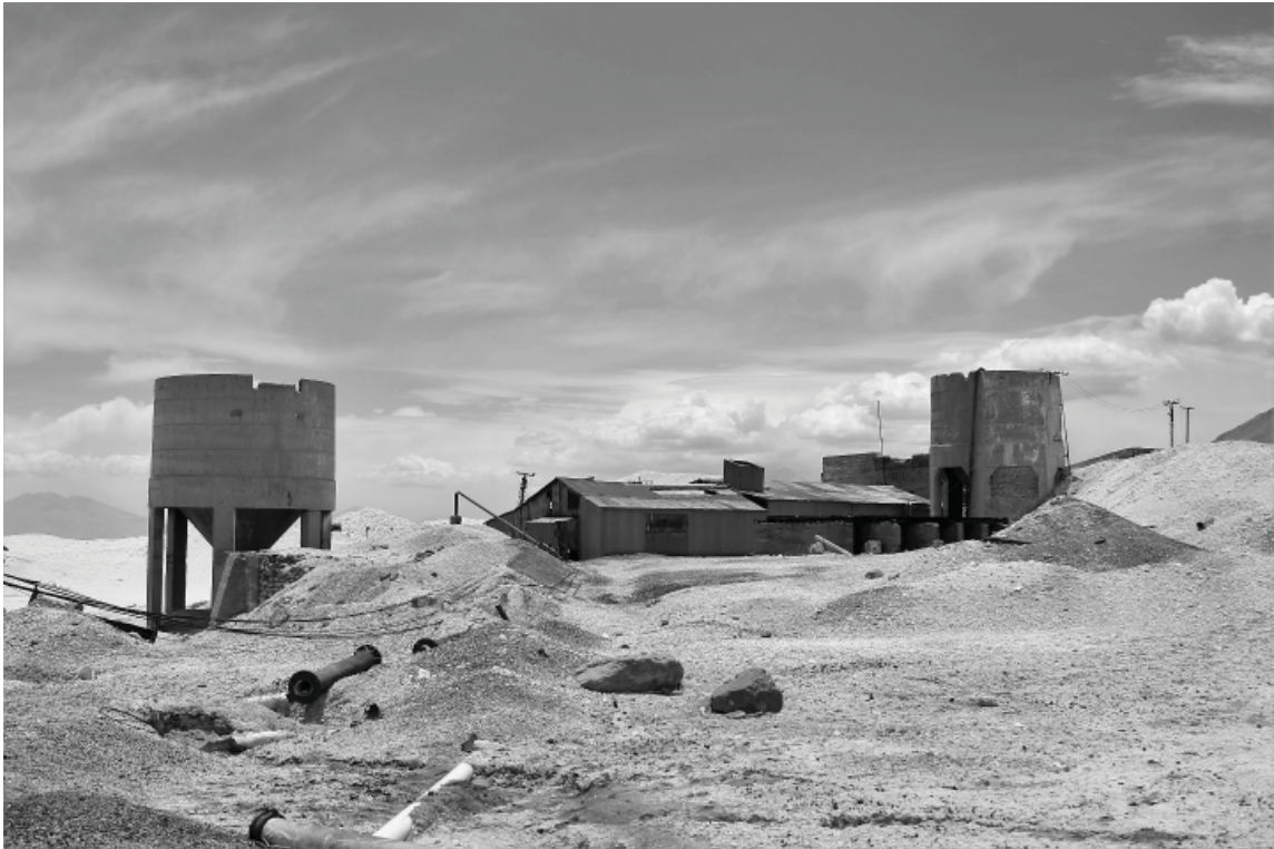
Figura 1. Ruinas actuales de la planta industrial de Amincha.

“Ante numerosas peticiones de azufreras, especialmente de la Provincia de Antofagasta, elevadas a la Caja de Crédito Minero, solicitando préstamos para continuar la exportación de los yacimientos y refinar en seguida los caliches de azufre, ese organismo acordó la creación de una planta beneficiadora. En efecto, y a fin de que tenga carácter regional, será instalada en la Provincia de Antofagasta y ubicada en el punto denominado ‘Amincha’, en la región de Ollagüe donde se ha comprobada la existencia de enormes cantidades de ese caliche. Para la instalación de dicha planta se acordó destinar la cantidad de $3.000.000, en atención a que la Caja cuenta ya con gran parte de las instalaciones. En cuanto a las numerosas solicitudes de préstamos sobre azufre se acordó en ese organismo no tramitar ninguna petición por considerar que en las ya hechas y las acordadas hay invertida una cantidad de dinero suficiente en relación con el capital de la Caja”.