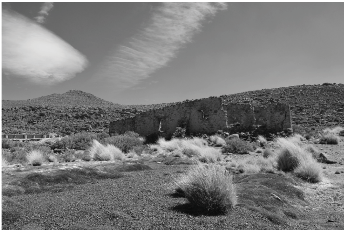
Figura 2. Antiguas instalaciones del campamento azufrero de Puquios, asociadas a una vega natural.

“cultural remembering proceeds not through reflection on a static memorial remnant but through a process that slowly pulls the remnant into other ecologies and expressions of value, accommodating simultaneous resonance of death and rebirth, loss and renewal” 22 .